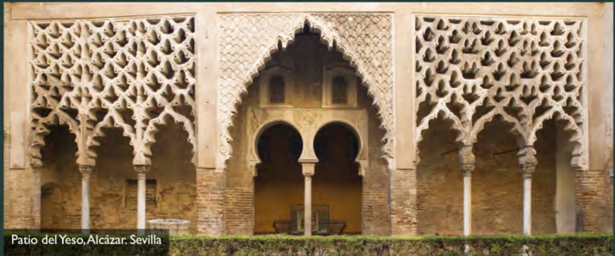
Patio del Yeso, Alcázar. Sevilla