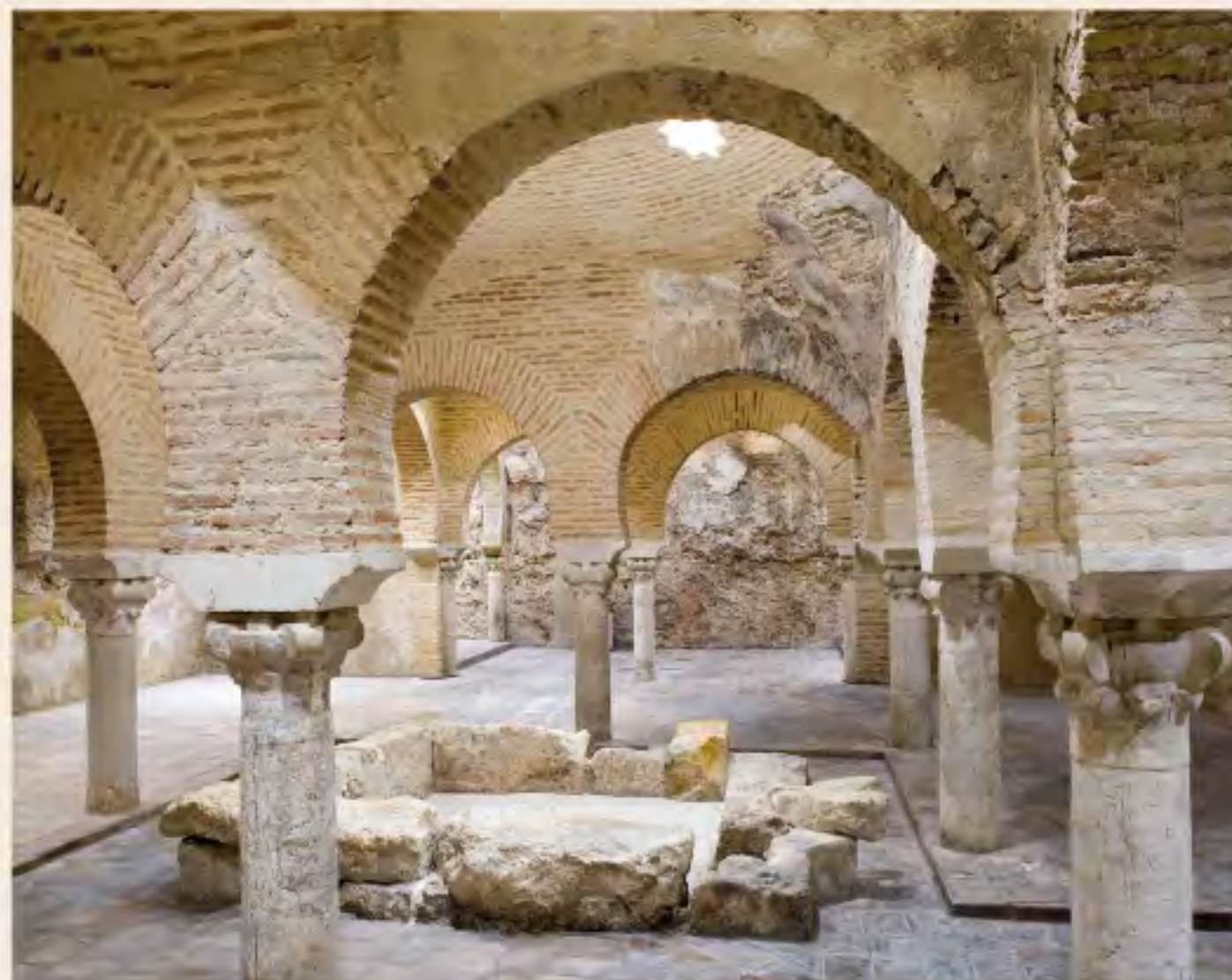
Baños de Villardompardo. Jaén