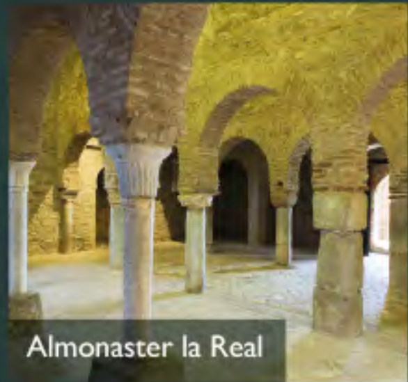
Almonaster la Real