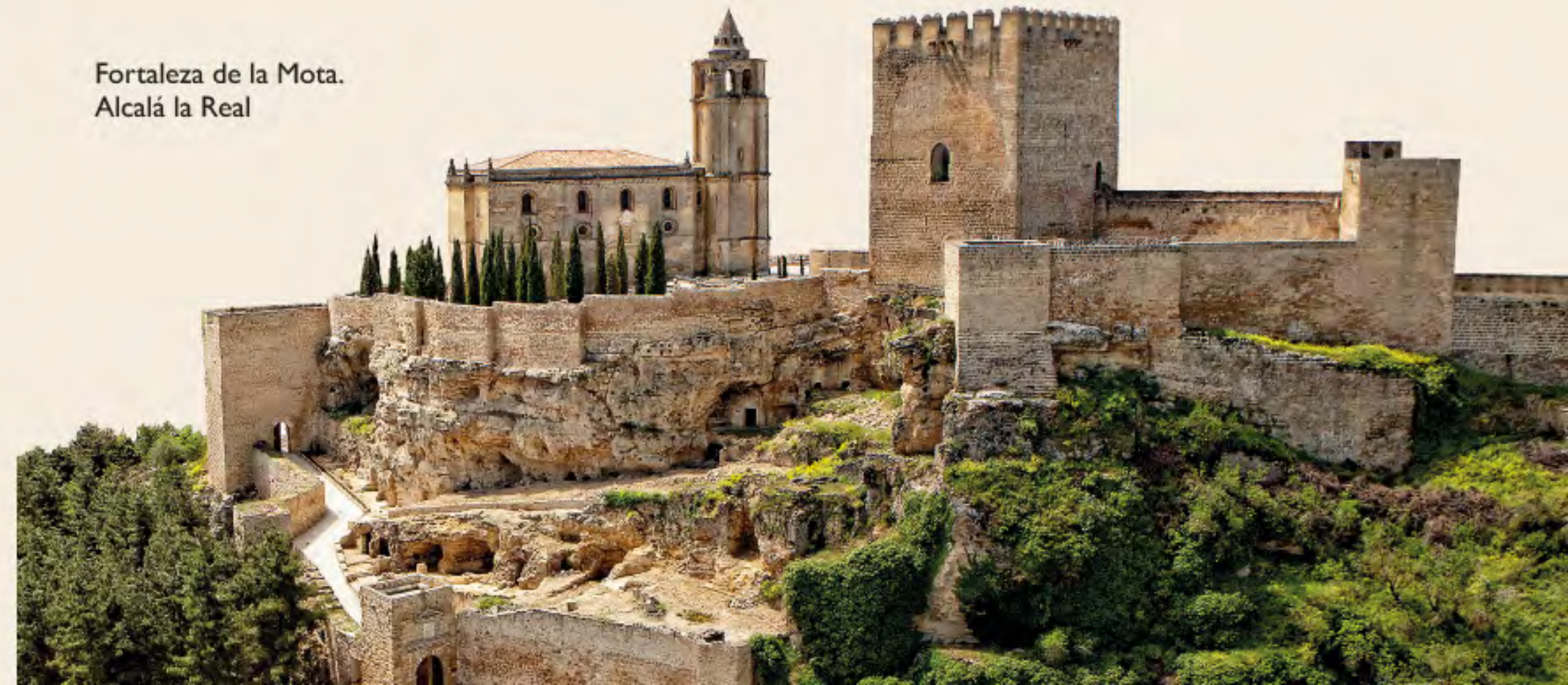
Fortaleza de la Mota. Alcalá la Real